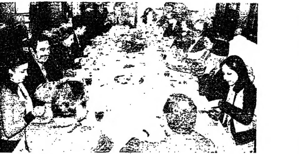
جانب من المدينة